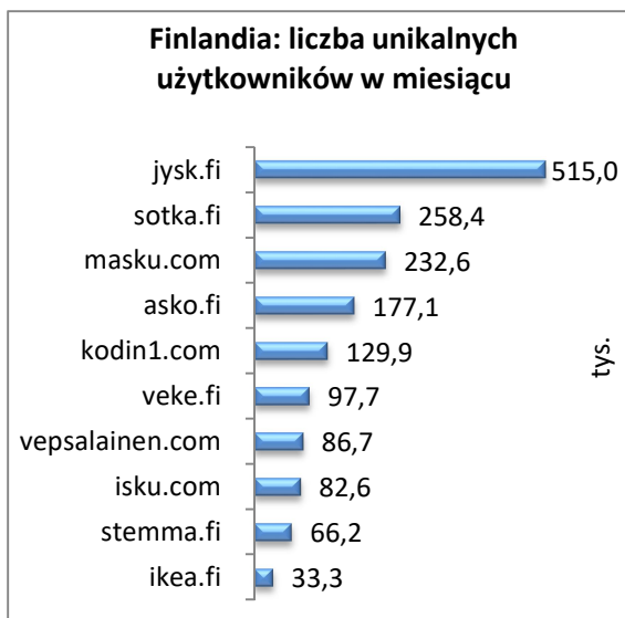
Rysunek 47 Finlandia: liczba unikalnych użytkowników w miesiącu