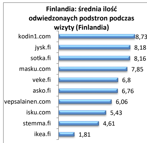
Rysunek 49 Finlandia: średnia ilość odwiedzonych stron podczas wizyty