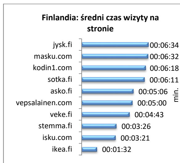
Rysunek 48 Finlandia: średni czas wizyty na stronie